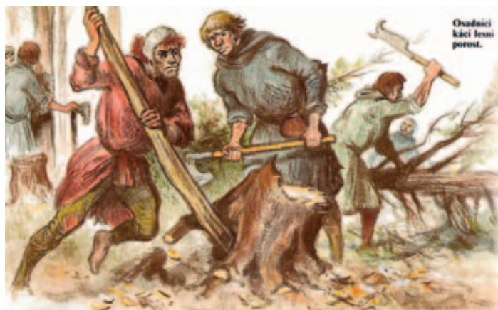
Ilustrace z knihy „České země za posledních Přemyslovců“ (Praha, Albatros 1993).

Nejistý zůstává délkový rozsah středověkého osídlení. V tomto případě nám může pomoci poloha holického kostela (první písemná zmínka z roku 1349). Byl postaven na vyvýšenině nad brodem přes Ředický potok, tedy nad křižovatkou hlavních cest. Jednak západovýchodní od Ředic přes osídlení Holic, jednak severojižní od Chvojna (potažmo Hradce Králové) přes Podlesí kolem kostela dnešní Klicperovou ulicí k Rovni (část zástavby této ulice se v padesátých letech dostala do areálu továrny a byla v nedávných dnech firmou Junker zbourána). Ještě si připomeňme, že až do roku 1928 tekla Ředický potok přes město a že pojem vyvýšenina pro lokalizaci kostela je oprávněný, protože v té době byl terén v úplně jiné výši než dnes (například přízemí středověkých domů jsou dnes sklepeními). Z uvedených skutečností můžeme odvodit, že se kostel nacházel blízko středu tehdejší vesnice. Vyvýšenina a blízkost křižovaty hlavních cest s brodem přes potok byla dobrá poloha i pro později postavenou tvrz (po roce 1350) naproti kostelu. Při zkoumání středověkých Holic se nenechme zmást označením Staré Holice. Vzniklo až o řadu století později (poprvé uvedeno v roce