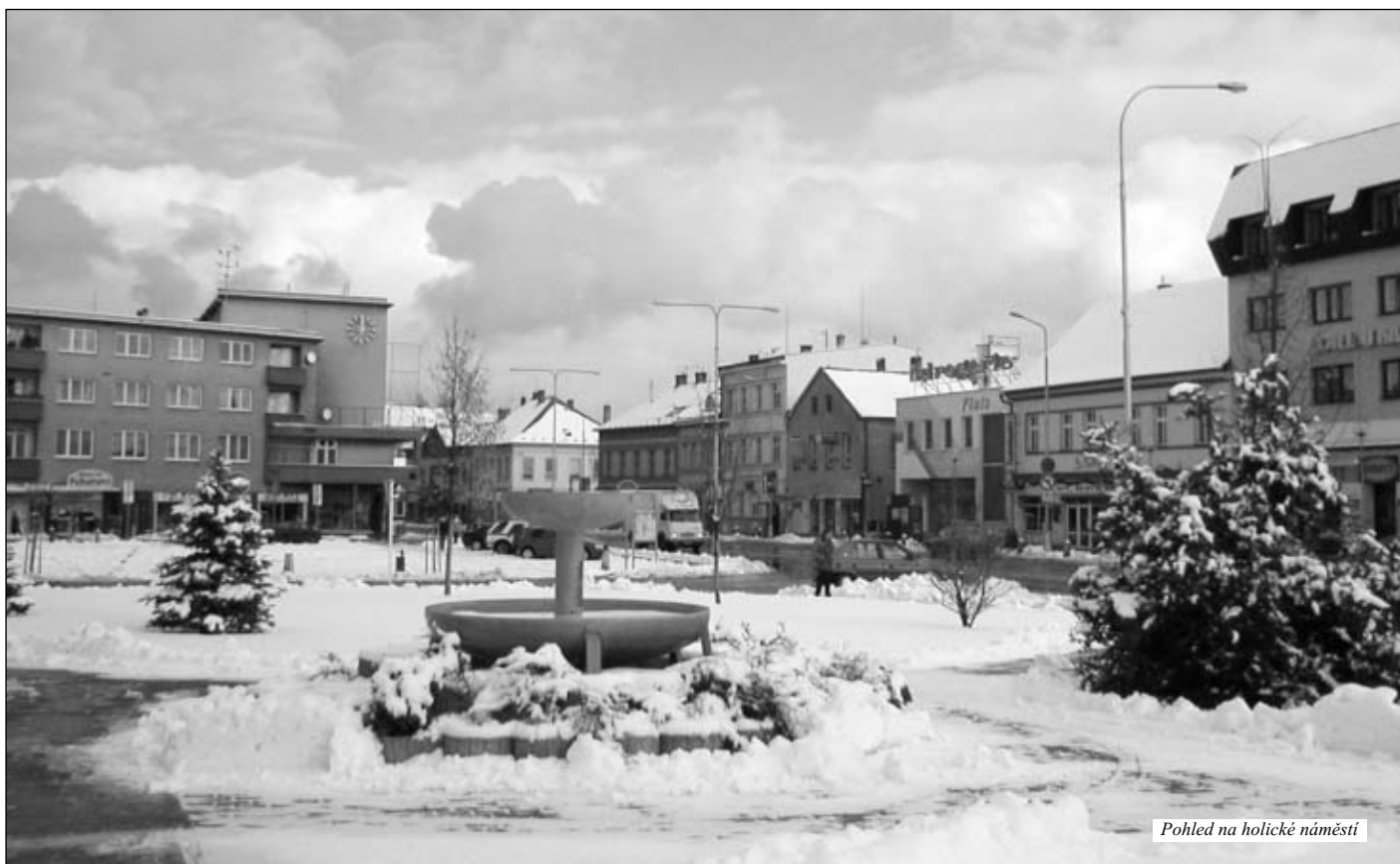
Pohled na holické náměstí