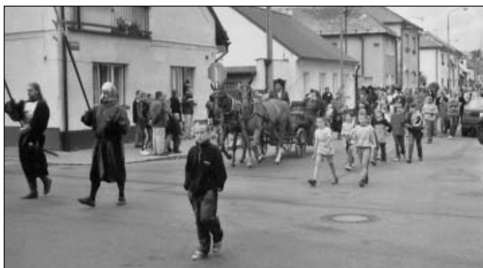
Městské slavnosti v roce 2002

Na paměť této události, tj. průjezdu Jana Lucemburského Holicemi, uspořádalo 21. června 2002 Město Holice a Kulturní dům vzpomínkovou akci s napodobením průjezdu Jana Lucemburského do Holic.