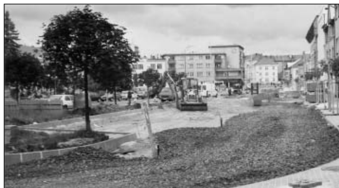
Rekonstrukce náměstí v roce 2002

Od té doby se prováděly na náměstí různé terénní úpravy a nynější konečná rekonstrukce byla provedena v roce 2002, jak je uvedeno na následující fotografii. Současně byla provedena rekonstrukce některých podzemních inženýrských sítí.