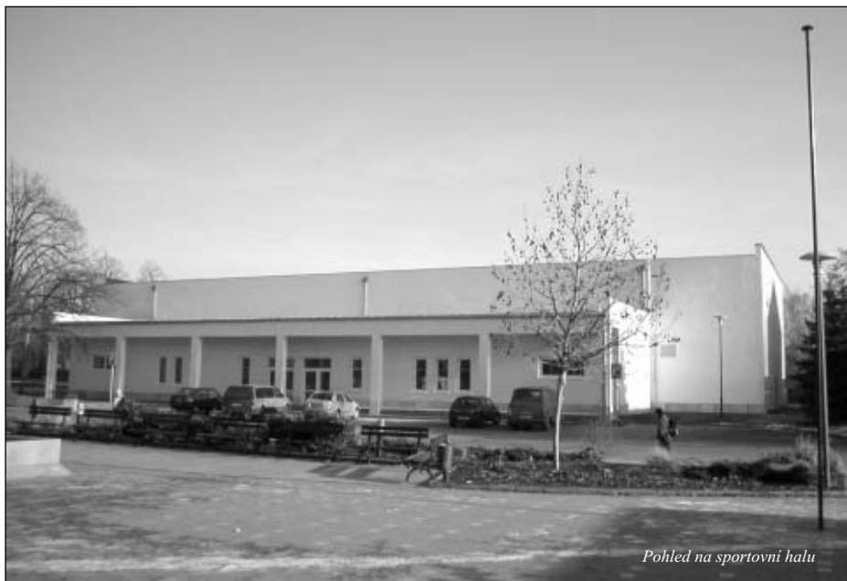
Pohled na sportovní halu