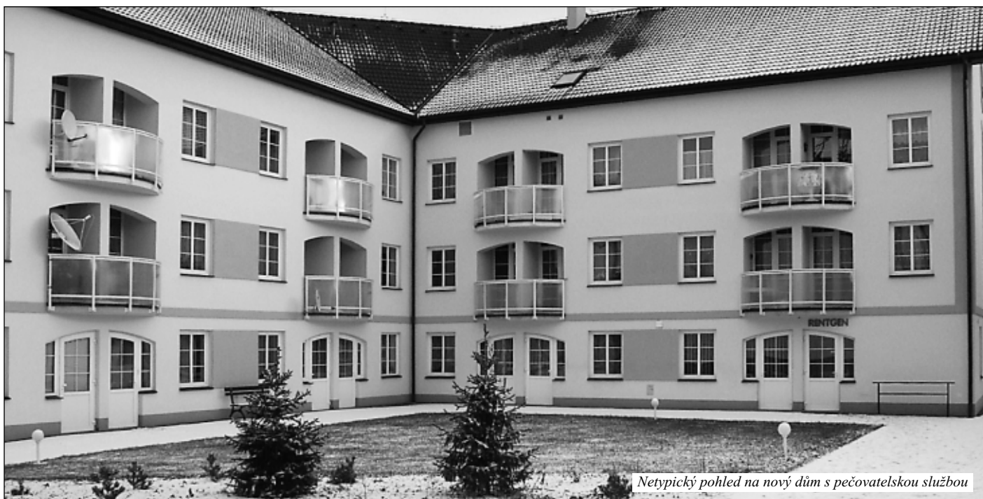
Netypický pohled na nový dům s pečovatelskou službou

Otázky položil a odpovědi zaznamenal Miloslav Kment