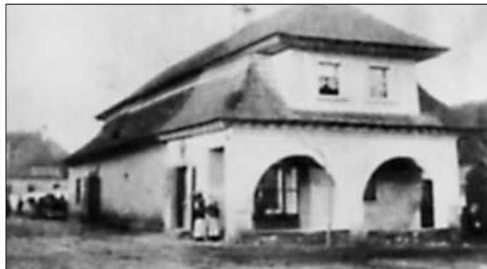
Stará pošta na náměstí

Holice měly v první polovině 19. století 788 domů a 5 291 obyvatel. Domy byly většinou dřevěné – roubené. Bylo tomu tak i na náměstí, kde střechy byly dřevěné – šindelové. Několik roubených domů bylo s tzv. podsíněmi. Z domů na náměstí se nejdéle zachovala nárožní stará pošta, zbořená teprve roku 1896. Stála v místech nynějšího domu čp. 19 – bývalé Občanské záložny.