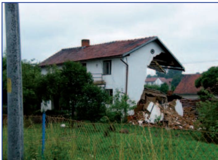
Záplavou poničený dům v Jeseníku nad Odrou

Během léta proběhla v Holicích „povodňová sbírka“, jejíž výtěžek byl podle usnesení zastupitelstva určen obci Jeseník nad Odrou. Zároveň zastupitelstvo rozhodlo, že město přispěje na tuto sbírku částkou 50 000 Kč. Občané a instituce pak přispěli sumou 101 400 Kč, což tedy dohromady činí 151 400 Kč.