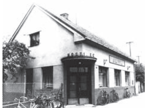
Bývalý hostinec Na Hrázi (foto z roku 1976).

Pivo bylo také třeba někde vypít, a tak se zmiňme alespoň stručně o holických hostincích (zpracování jejich historie nám zatím ještě chybí). O prvním šenkovním domě u nás se zmiňuje privilegium Neptalima z Frimburka z roku 1493, kterým uděluje rychtáři Ondřejovi svobodu rychty. Kromě jiného dostal právo v rychtě (pravděpodobně dnešní poliklinika) šenkovat pivo, a to i pro své budoucí následovníky, aniž by z toho musel platit vrchnosti nějaké poplat-