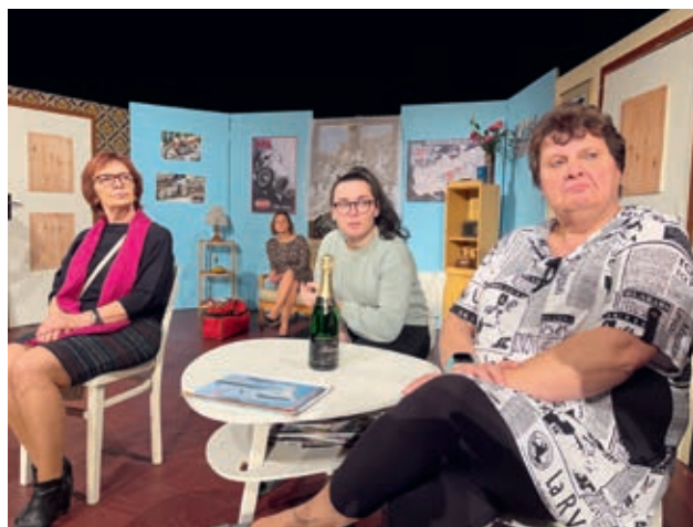
Dámská část hereckého souboru