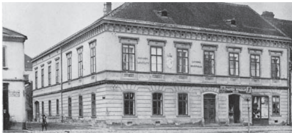
Původní budova okresního domu čp. 10, dnes Komerční banka v Holicích.

Ve třetím díle tohoto seriálu jsem zmiňoval obsah adresáře z roku 1926. Současně jsem uvedl stav občanů, uvedený v adresáři na základě voličských seznamů z oné doby. V dalších se chci věnovat hlavně výčtu řemesel, živností a různých institucí. Nemohu však vynechat údaje o vedení města a působení různých spolků, společností a sdružení, které v jisté míře ovlivňovaly život obce.