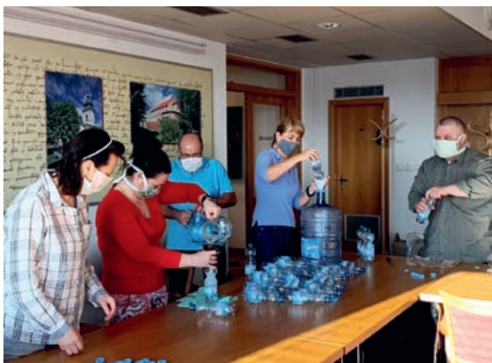
Plnění lahví dezinfekcí pro zdravotníky