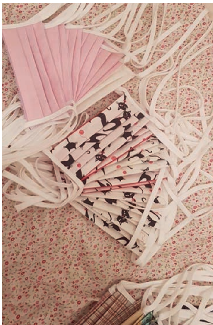
Facebooková skupina Roušky pro Holice a okolí zmobilizovala desítky domácích švadlen a našla tisíce roušek