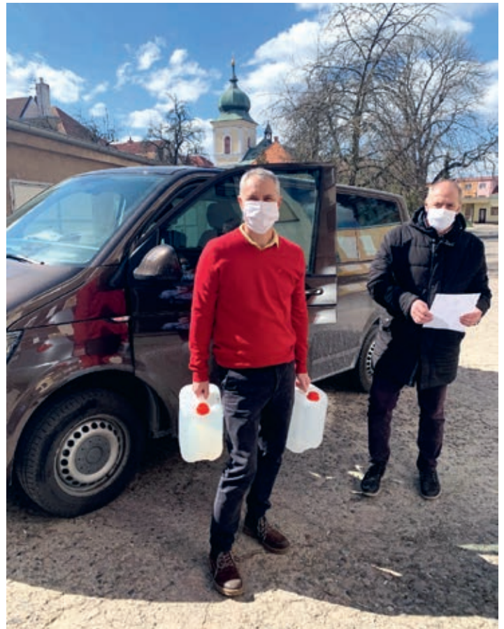
Dar od nadace Antonín Šporka