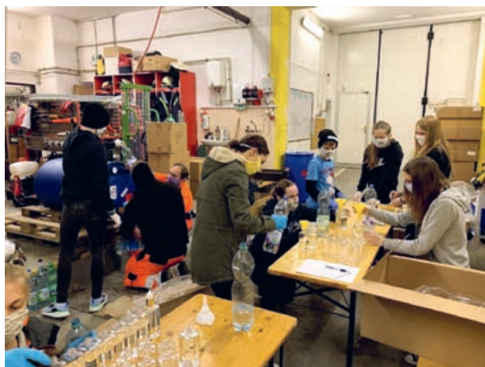
Plnění lahvíček dezinfekcí – v akci skauti, hasiči a technické služby