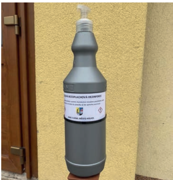
Dezinfekce rozmístěná na 15 místech po Holicích