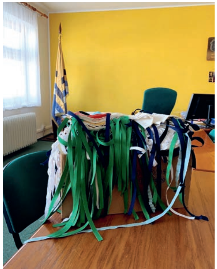
Distribuce tisíců roušek šitých zaměstnanci příspěvkových organizací, městského úřadu i desítek dobrovolníků