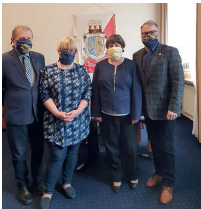
Vedení partnerského města Strzelce Opolskie v rouškách z Holic