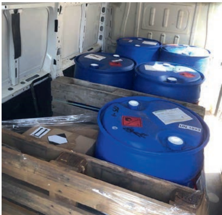
Přijela dlouho očekávaná objednávka dezinfekce z Německa pro občany města Holic