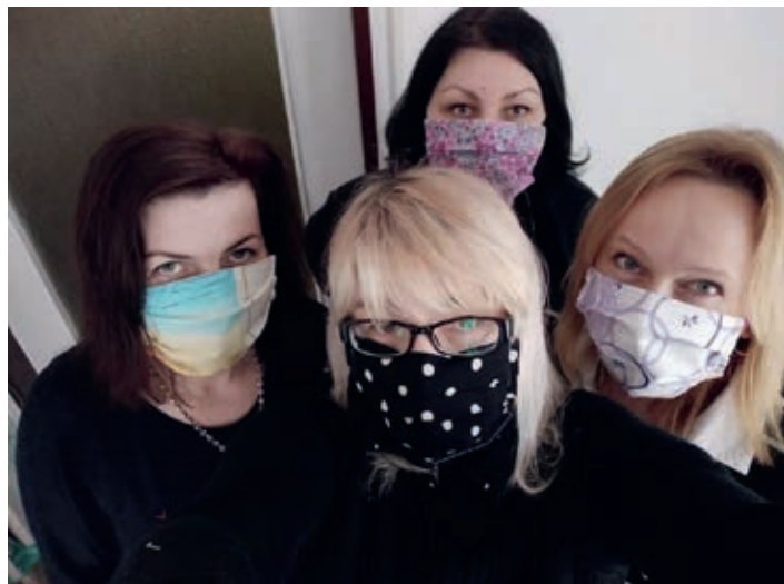
I půjčovna kostýmů se aktivně zapojila do sítě roušek