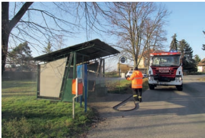
Dezinfekce venkovních prostor ve městě a přilehlých částech – spolupráce hasičů a technických služeb