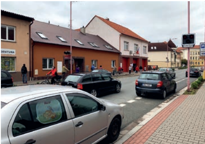
Rozdávání roušek a dezinfekce za pomoci Hasičů Holice a Skautů Holice