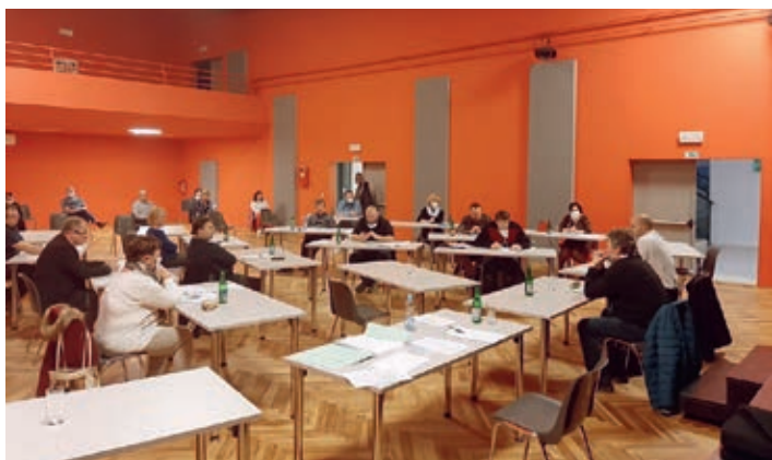
Zasedání zastupitelstva města s dodrženími dvoumetrovými odstupy