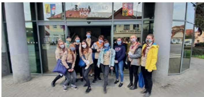
Skauti při distribuci roušek mezi občany města