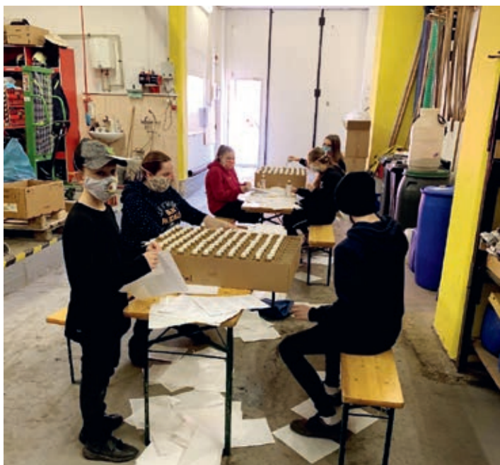
Mladí skauti a hasiči museli nejdříve dezinfekci naplnit a oblepit tisíce lahvíček