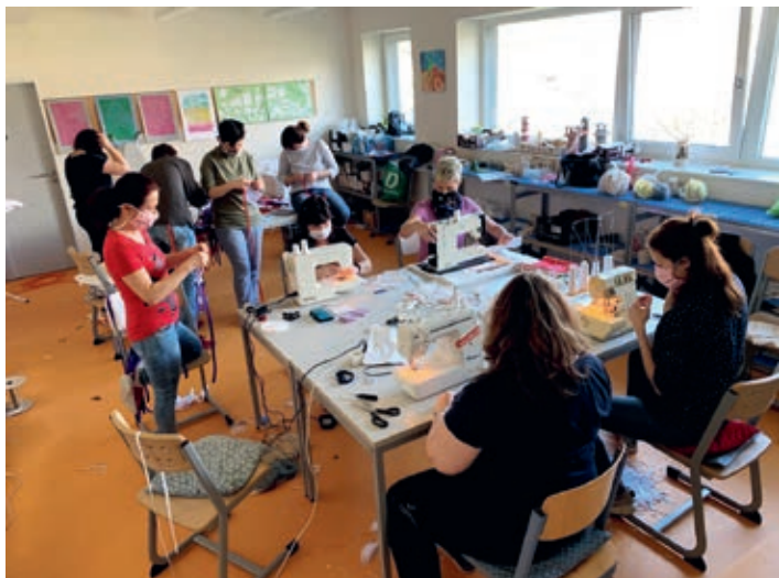
Šicí dílna v ZUŠ Karla Malicha