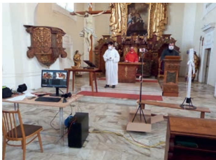
Bohoslužby z kostela sv. Martina byly streamovány přes kanál youtube