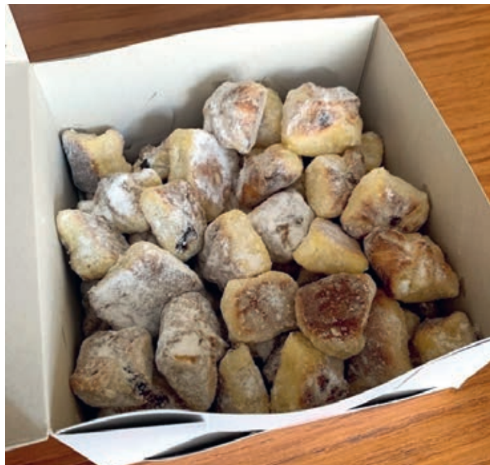
„Dobry den, roušky šít neumím, ale přinesla jsem alespoň něco na zub...“ A tato zcela anonymní paní nebyla jedinou, kdo v té době pomáhal, jak mohl. Zůstane nám to?