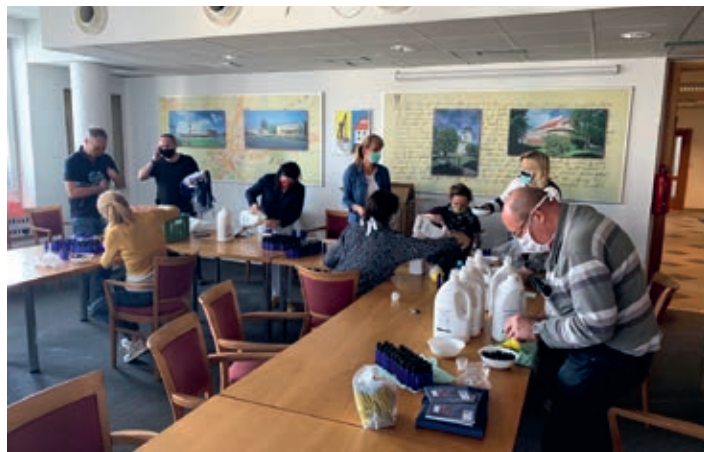
Zaměstnanci městského úřadu rozlévají první várku dezinfekce pro lékaře