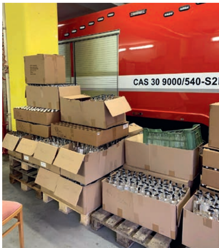
Naplňené lahvíčky připravené na výdej