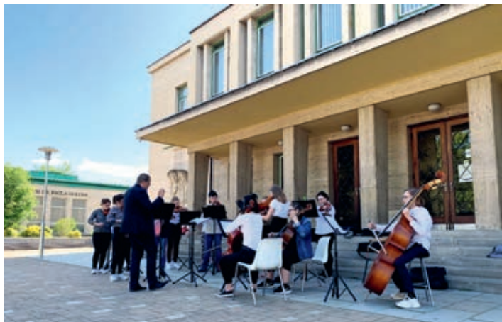
Byla obnovena možnost setkávání se na veřejnosti. ZUŠ Karla Malicha uspořádala Holický hudební týden