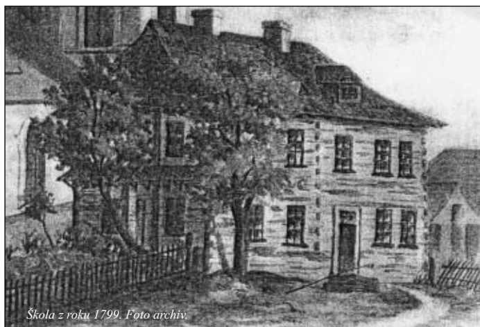
Škola z roku 1799.