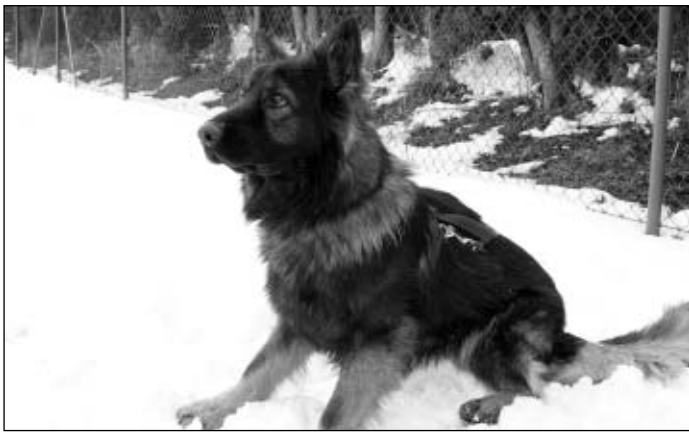
V inventáři je také pes Viki, s inventárním číslem 26/1

podle stanoveného splátkového plánu. Další větší položkou je půjčka z fondu rozvoje bydlení ve výši 1 900 000 Kč. Zbytek tvoří došlé faktury, jejichž splatnost byla v lednu 2005.