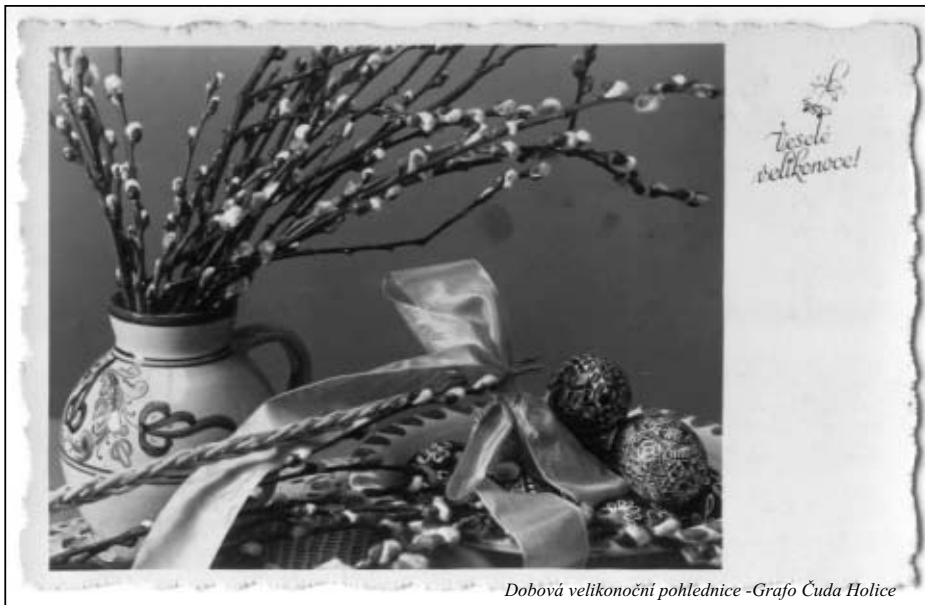
Dobová velikonoční pohlednice -Grafo Čuda Holice