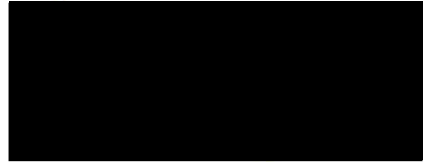
Mgr. Ondřej Výborný starosta města Holice