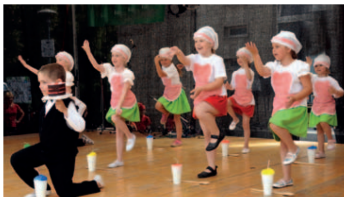
Malí cukráři z mateřské školky ve Staroholické ulici.