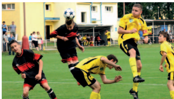
SK Holice uspořádal již 43. ročník Mezinárodního letního turnaje žáků, snímek je z utkání Spartaku Sezemice s MOS Strzelce Opolskie.