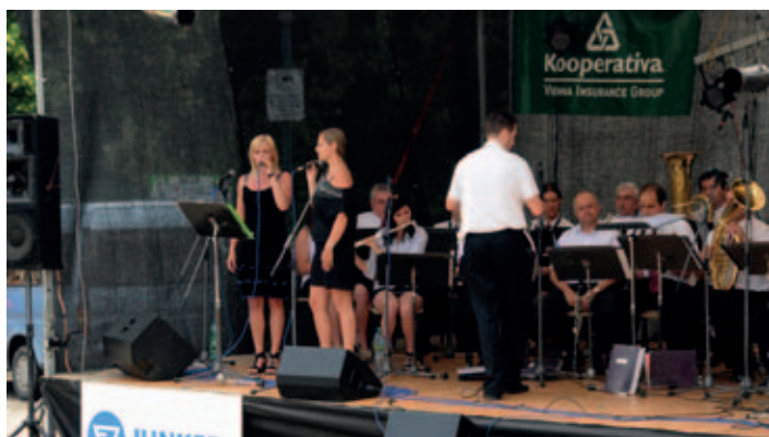
Sobotní kulturní odpoledne zahájila již tradičně dechová hudba KD Holice.