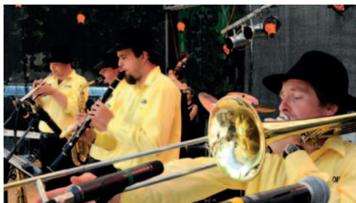
Nedělní odpoledne u KD patřilo swingu a jazzu, holická dixilendová kapela J.G. Dix odpoledne otevřela.