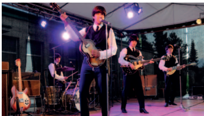
The Beatles už nikdy nevidíme, ale jejich písničky stále žijí a vystoupení košické skupiny The Backwards bylo jednoznačně vrcholem sobotního večera.