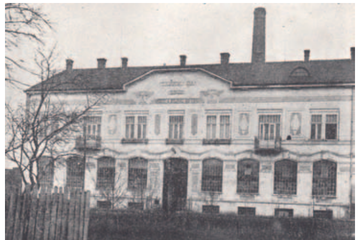
Továrna firmy „Šimon a Eduard Schick“ v roce 1911

na náměstí. V roce 1902 do čp. 16 (dnešní ČOB) přestěhoval z Borohrádku továrnu David Klein a v roce 1904 na druhé straně náměstí v čp. 23 zřídil továrnu Sigmund Stein.