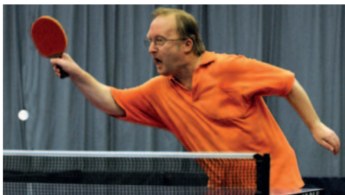
Součástí sportovní neděle byl mezinárodní turnaj družstev ve stolním tenise, který uspořádal oddíl Jikry Holice.