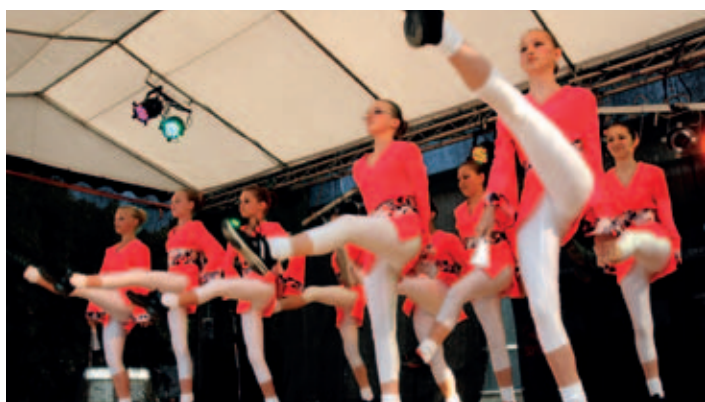
Taneční klub APEL a působivé vystoupení jeho tanečnic.