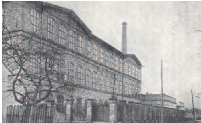
Továrna firmy „Hermann Hirsch“ v roce 1911