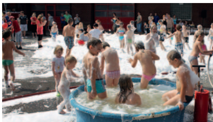
Sbor dobrovolných hasičů Holice uspořádal „Den otevřených dveří“ a dováděním v pěně se osvěžovaly hlavně děti.