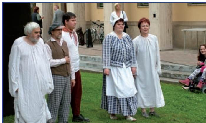
V nedělním dopoledni hráli divadelní soubory především dětem. Werichova Nebojsu zahrál soubor ochotníků KD Holice.