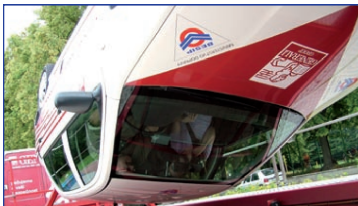
Fotka dobře, auto vzhůru „nohama“. Pocity v kutálejícím se autě bylo možno zažít ve stánku pojišťovny Generali.