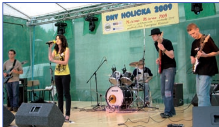
Družební polské město Strzelce Opolskie reprezentovala začínající rocková formace The Freaks.