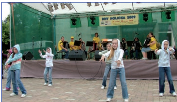
Ze slovenského Medzeva přijeli mladí tanečníci, resp. tanečnice a harmonikáři a harmonikářky. A ještě dva flétnisté a jedna dirigentka.