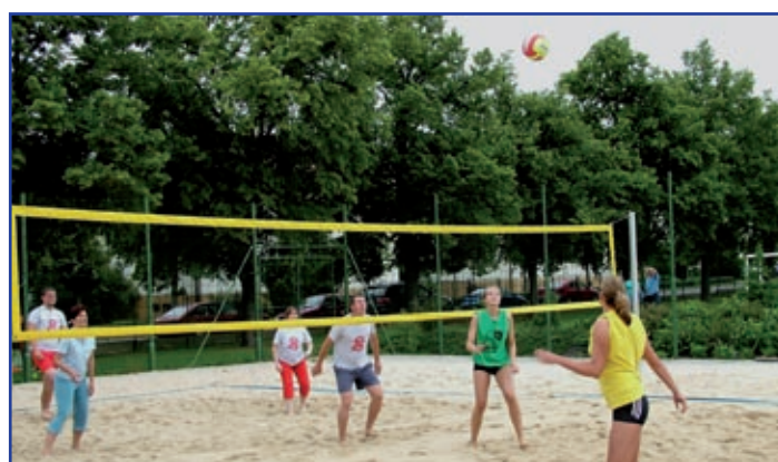
Neděle, to je také turnaj v plážovém volejbalu na kurtě u domu dětí a mládeže. Ten letošní vyhráli mladí, tedy družstvo „Mláďi“