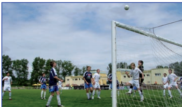
Žákovský mezinárodní fotbalový turnaj vyhrál opět Baník Ostrava (bílí), když finálové utkání se odehrálo v jeho režii a „mladí baníci“ vyhráli ve finále nad Zentivou Hlohovec 4:0.