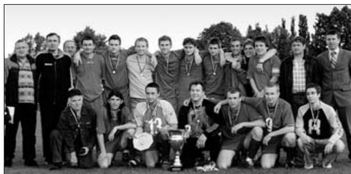
SK Holice se stal vítězem krajské části Poháru ČMFS