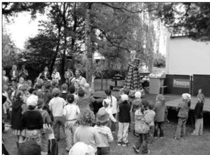
Všem holickým dětem přejeme krásné slunečné prázdniny.

Se školním rokem se děti rozloučily před zcela zaplněným sálem na závěr akademie společnou písní „Hlavně že jsme na vzduchu“. My všichni při pohledu na ty krásné a šťastné děti jsme cítili radost a spokojenost. A již se těšíme na další školní rok a společná setkání.