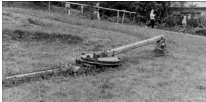
Železný žentour ve skanzenu na Veselém kopci u Hlinska.

Zvířecí síla byla používána též k pohonu tzv. žentourů. Žentoury byly poháněny mlátičky, šrotovníky, mlýny, kolářské soustruhy, řezačky píce apod. Původní žentoury byly dřevěné. Zhotovovali je mlynáři a sekerníci. Od poloviny 19. století již byly v prodeji žentoury tovární