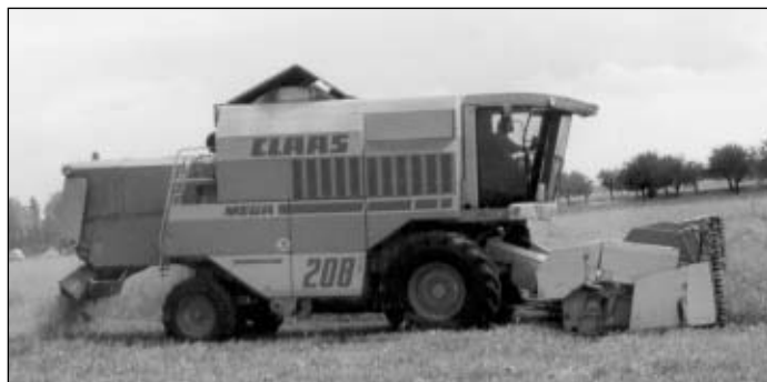
Kombajn při sklizni na poli na Podhrázi.

V roce 1770 bylo v Holících provedeno měření pozemků, tzv. zástěrovské, podle inženýra Zástěry. Toto měření bylo později použito jako podklad měření za císaře Josefa II. v letech 1785 – 1788 k tzv. Josefskému katastru. Josefský katastr evidoval hospodářskou užitkovou půdu v zemi (poddanskou i panskou). Neplodná půda (veřejné prostranství, cesty, vodní toky a jiné) nebyla do katastru pojata. Poddanská i panská půda měla být zdaněna stejně. Základem zdanění byl hrubý výnos pozemků zjištěný oceněním přiznané sklizně podle průměrných cen za desetiletí 1774 – 1784. Berní sazba z jednotlivých kultur přihlížela k vyšší výrobních nákladů (vyšší u pastvin, lesů a luk,