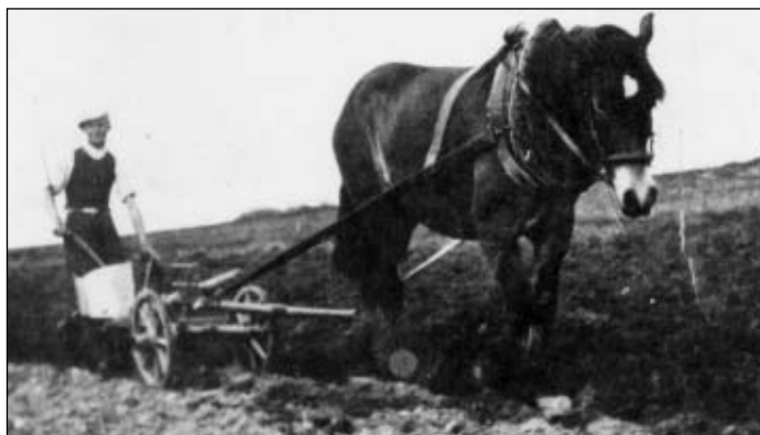
Koně byli hlavní tažnou silou.

V roce 1713 již bylo v Holících 77 řemeslníků a obchodníků; z těch bylo 19 tkalců, 7 řezníků, 2 handlíři s obilím, handlíř s dobytím, kramář, kožešník, provazník, tesař aj. Mezi nimi byl i písař, kantor, serbus (úřední /obecní/ sluha) a výběrčí akcí (daní). Bylo zde také napočítáno 140 koní, 43 volů, 136 krav, 89 kusů hovězího dobyt-