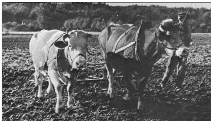
I krav se používalo jako tažné síly.

Dle berní ruly z roku 1654 však již bylo v Holících 40 hospodářů, kteří obhospodařovali od 21 do 104 strychů (korců) orné pudy. Jeden korec = strych = 800 čtverečních sáhů = 29 arů (1 ar = 100 m 2 ). Dále zde bylo 13 chalupníků, kteří obhospodařovali od 3 do 20 strychů orné