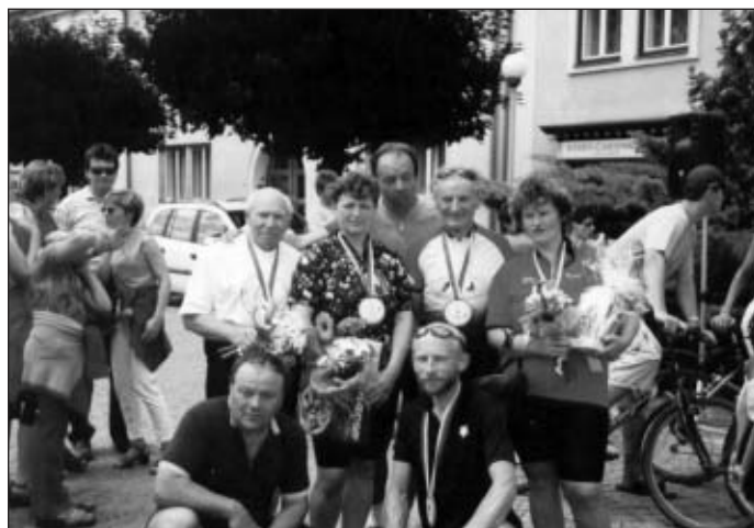
Oddíl cyklistiky holického Sokola