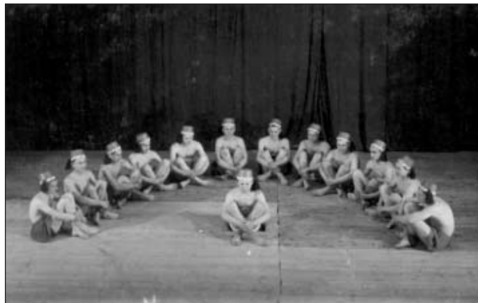
Sokolská akademie ze čtyřicátých let

Provozována byla lehká atletika, volejbal a česká házená. Konec rozvoje znamenala nacistická okupace. Činnost jednoty byla zakázána, za