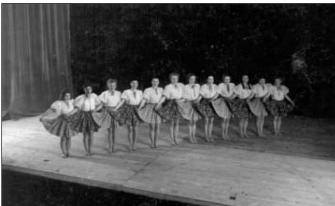
Sokolská akademie ze čtyřicátých let

Sokolovna byla vybudována z darů, z prodeje dluhopisů a za podpory občanů Holic. Byla otevřena II. župním sletem již 3. srpna 1913. Později byly zakoupeny další pozemky, vybudován sokolský park, hřiště a koupaliště. Původní rozpočet byl silně překročen a dluh splácen 20 let. Výstavbou pošty, soudu a „opatrovny“ vznikla v této lokalitě tehdy nejhezčí část města. Sokol vyvíjel bohatou činnost i za první republiky. Cvičily všechny věkové skupiny, muži patřili mezi nejlepší v Orlické župě, místní cvičenci nechyběli na žádném sokolském sletě.