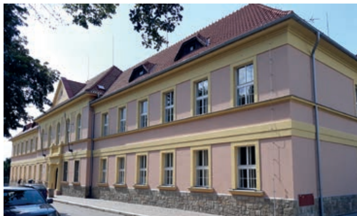
ZŠ Komenského má na školní budově Holubova čp. 500 novou fasádu za cca 7 mil. Kč.