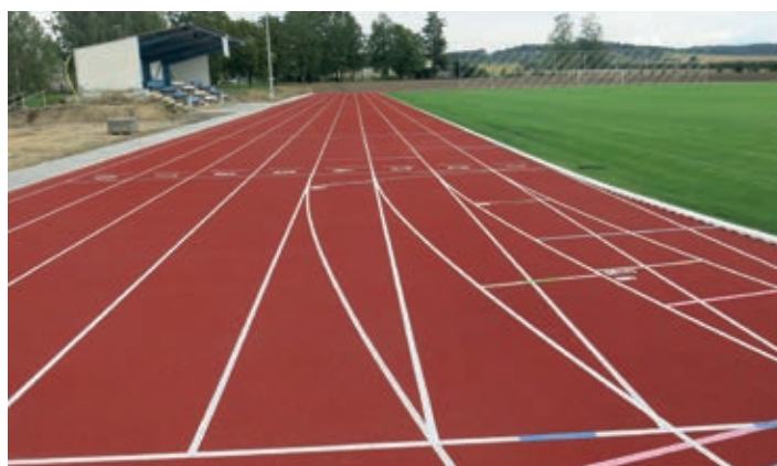
Atletický ovál má čtyři dráhy, cílová rovinka pro sprinty je s osmi drahami.