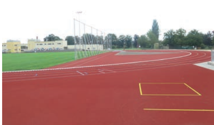
Na stadionu je pro sportovce připravena nová atletická dráha s technickými sektory s umělým povrchem.