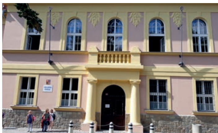
Čelní pohled na novou fasádu.