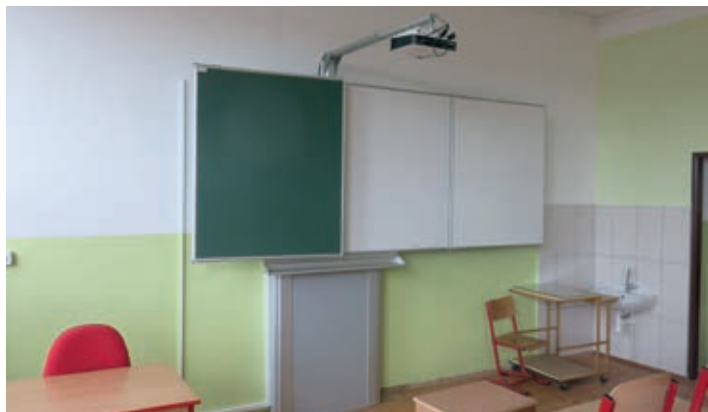
V ZŠ Holubova se přes prázdniny prováděly 4 akce za celkem 11 mil. Kč s dotací 4 mil. Kč. V rámci konektivity a IT sítě se instalovaly ve třídách nové interaktivní tabule.