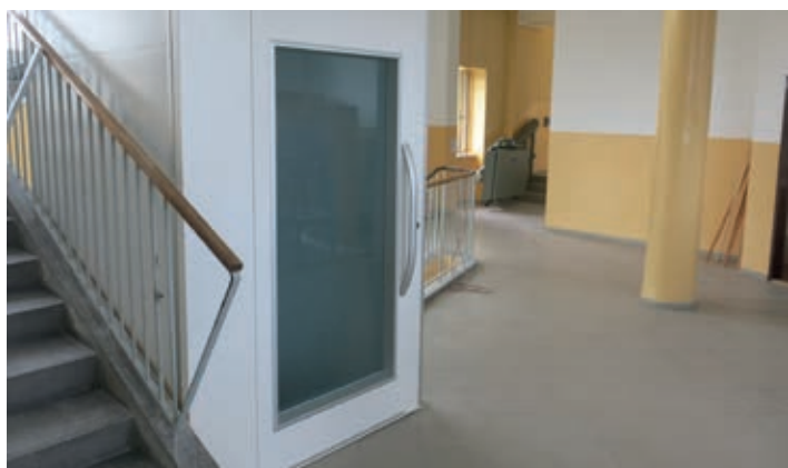
ZŠ Holubova – v rámci akce „bezbariérové školy“ byl nově instalován výtah.