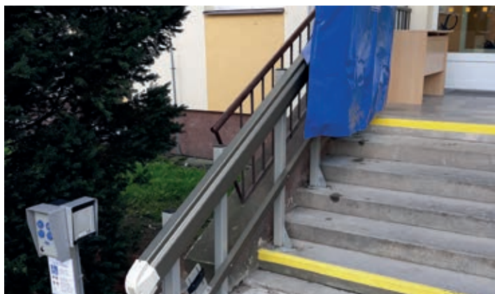
ZŠ Holubova – na každém vedlejším schodišti, včetně vstupního, je plošina pro vozíčkáře.