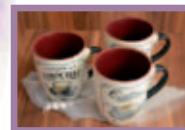
Hrnečky (cena od 82 Kč)