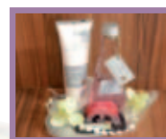
Kosmetika (cena od 60 Kč)