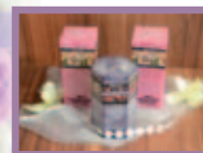
Dekorační svíčky (cena od 44 Kč)