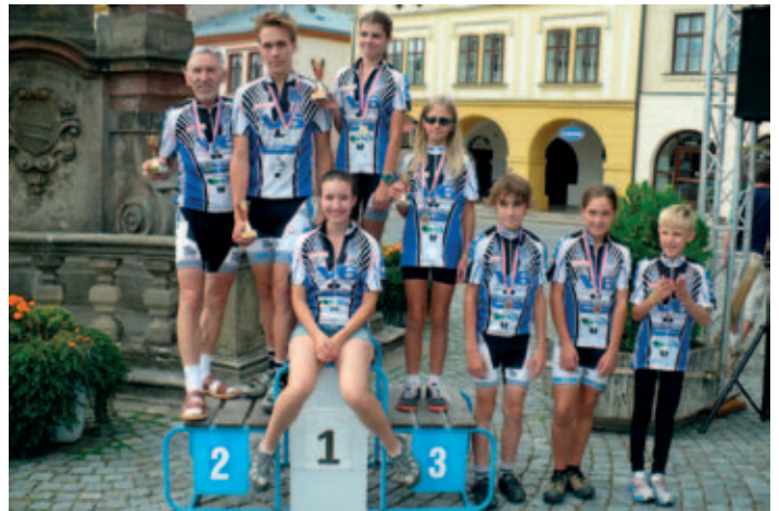
Závodníci s poháry DP 2013

V neděli 8. 9. 2013 byl v Dobrušce ukončen 20. ročník cyklistického Dobrušského poháru, což byla série 7 závodů na silnici a 4 závodů horských kol, kterých se zúčastnilo celkem 269 závodníků.