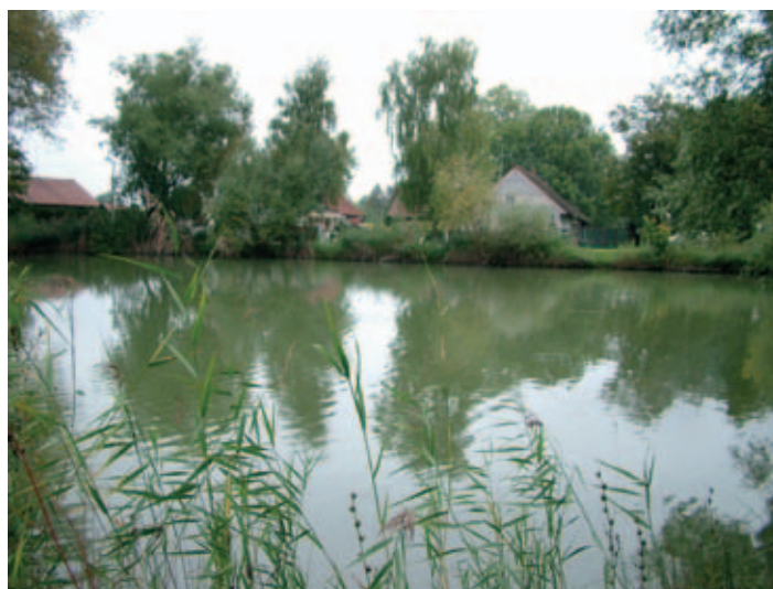
rybníček v Roveňsku

Jedeme-li do místní části Podlesí, netušíme, že také tady silnice před osadou vede po hrázi bývalého rybníka, který se nazýval Dolní Šibeničný. Snížený terén napravo od silnice a dosti mokrá půda jsou pozůstatky po tomto rybníku. O kousek dál, severně pod Homolí, se v minulosti rozléval další rybník, zvaný Horní Šibeničný. S rozlohou obou rybníků se můžete lehce seznámit sami. Stačí zajít na městský úřad a podívat se