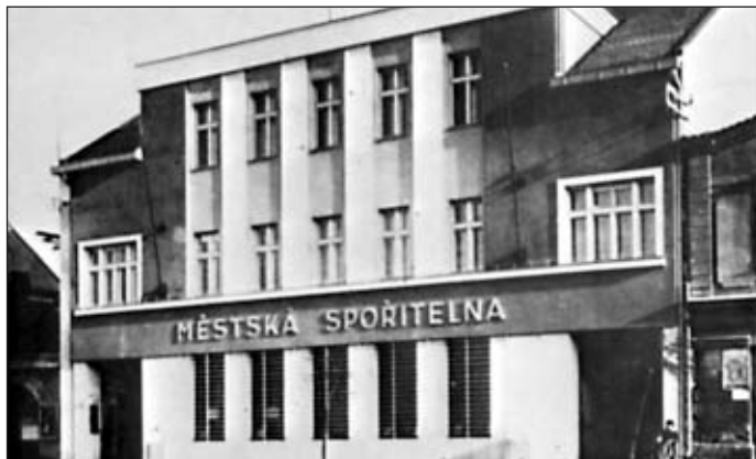
Městská spořitelna (asi 1930)

15. ledna 1921 bylo vedením města rozhodnuto koupit bývalý hotel Fišer na náměstí a umístit zde městskou spořitelnu. Dnes je v rekonstruované budově lékařské středisko, resp. poliklinika.