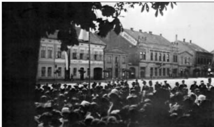
Bývalý hotel Fišer (asi 1920)

1. ledna 1911 se organizace sociálně demokratické strany rozdělila na sekci v Nových Holicích (160 členů) a ve Starých Holicích (75 členů).