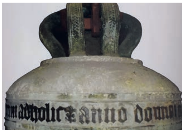
Lilie a za ní slovo Anno v nápisu na holickém zvonu Martin

martini ad holic , v překladu: Léta Páně 1499 je tento zvon ulit ke cti Boží a svatého Martina do Holic.