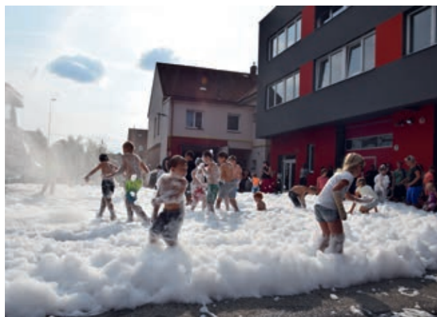
Bohatý program probíhal také v hasičské zbrojnici