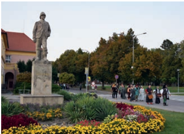
Středověký průvod městem zahájil víkendové oslavy