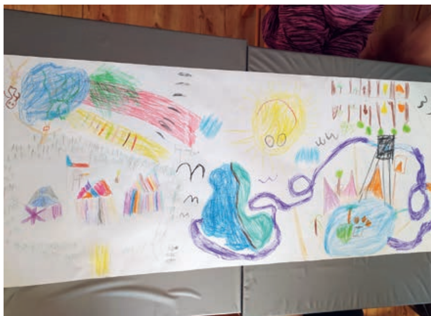
Dílo z programu Šikovné ručičky

Podzimní vzdělávání seniorů (trénink paměti, tvoření, počítače) se uskuteční v listopadu. Termíny včas oznámíme.