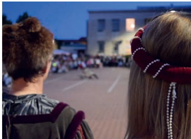
O historický program se postarala umělecká agentura Historicus