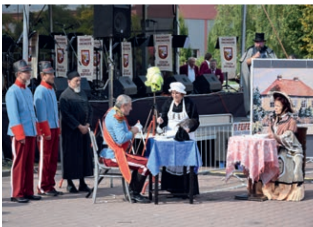
Historií města nás provedli holičtí ochotníci