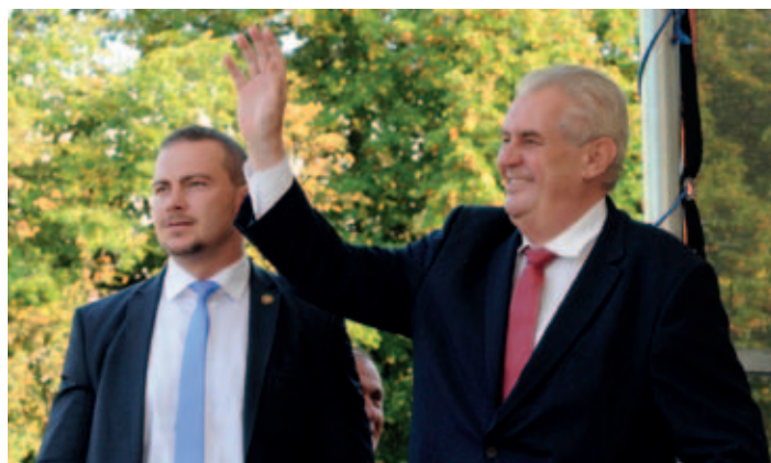
Před kulturním domem se prezident přivítal s občany.