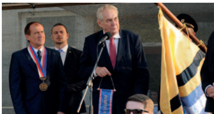
Návštěvu prezidenta nám bude připomínat „Pamětní stuha prezidenta Miloše Zemana“, která nyní zdobí holický prapor.