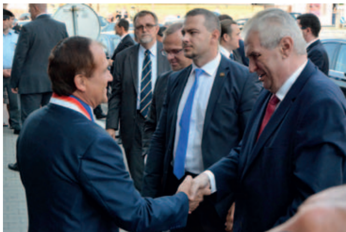
Před radnicí přivítal prezidenta Miloše Zemana starosta Ladislav Effenberk.