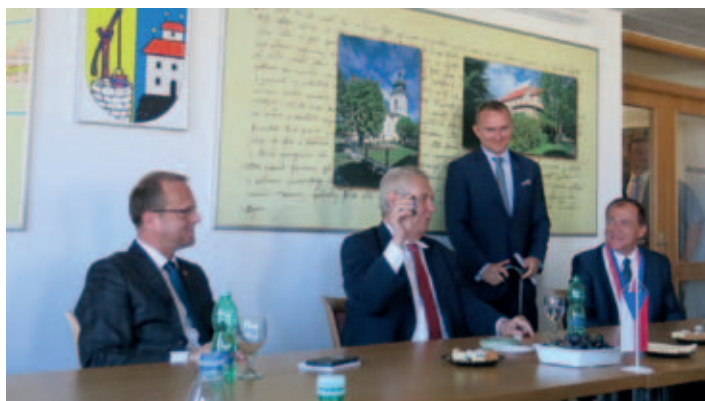
Kromě oficiálních darů a s patřičným vtipným komentářem si odvezl i připravený zapalovač.