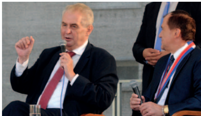
Prezident odpovídal na otázky přítomných občanů.