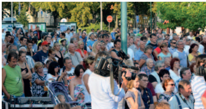
Prostranství před kulturním domem bylo zaplněno občany, kteří byli zvědaví na vystoupení českého prezidenta.