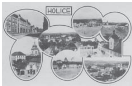
Fotografie města Holic ze 30. let minulého století

V adresáři obyvatel jsou zahrnuti všichni, kteří