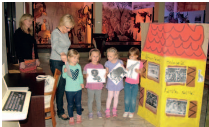
Velice milé vystoupení dětí z MŠ Holubova