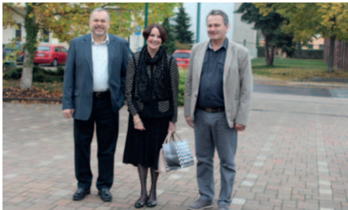
První fotografie po příjezdu paní velvyslankyně do Holic