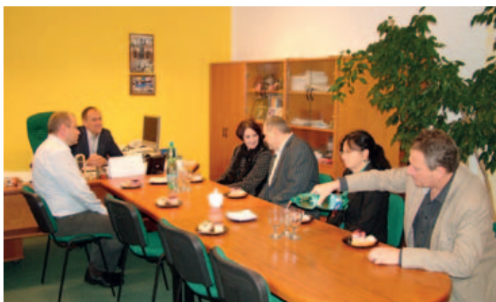
Oficiální přijetí u starosty města