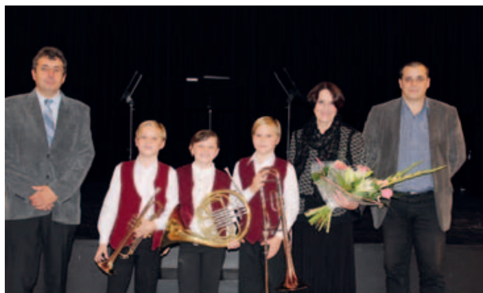
Poslední zastávkou byla návštěva ZUŠ Karla Malicha