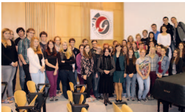
Setkání se studenty a pedagogy Gymnázia Dr. Emila Holuba