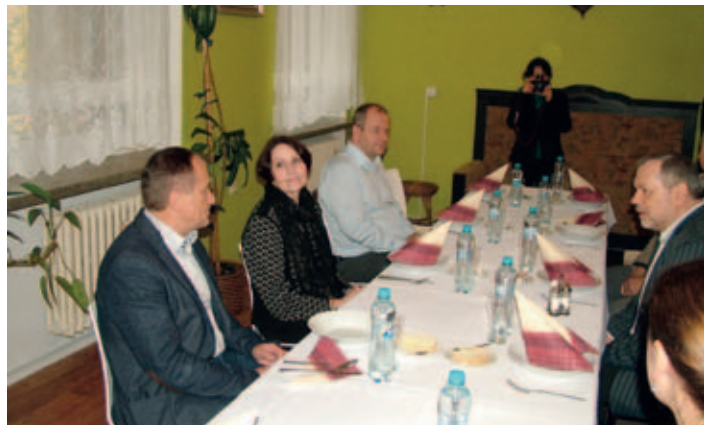
I při obědě měla paní velvyslankyně mnoho otázek