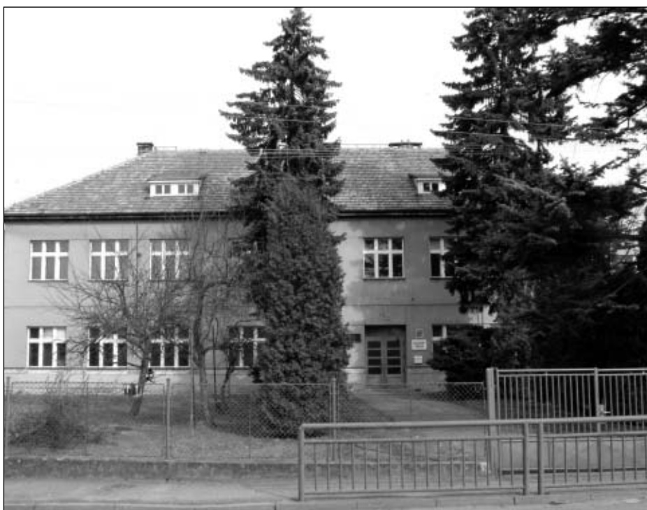
Budova bývalé staroholické školy