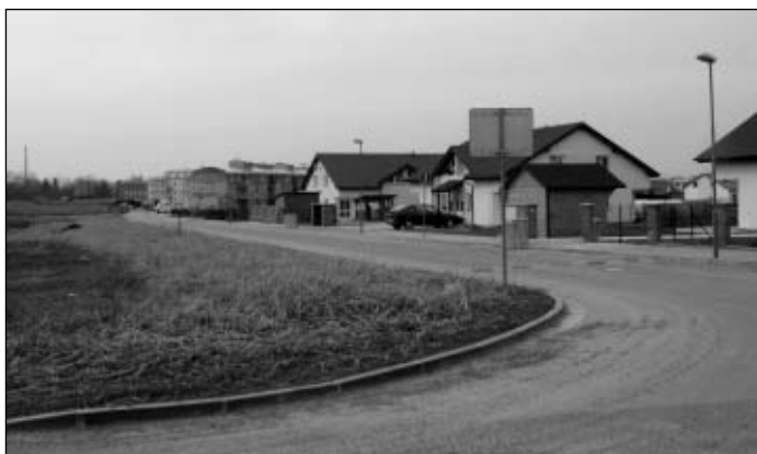
Otmarova ulice propojí lokalitu „Muška“

Hospodaření města podléhá podle zákona o obcích kontrole hospodaření auditorem. Audit byl proveden nezávislým auditorem v termínech 22. – 23. 11. 2003 a 9. – 11. 2. 2005. Přezkoumání hospodaření města za rok 2004 bylo ukončeno „bez výhrad“.