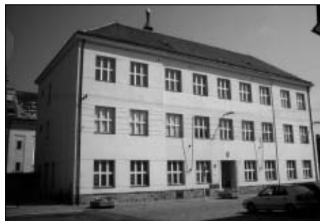
Škola postavená po roce 1876 u kostela.