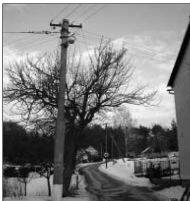
Cesta na Kamenec

Starostovi uložila rada projednat s firmou VČE Montáže možnost splátkového kalendáře na rekonstrukci veřejného osvětlení. Jde o součinnost akcí této