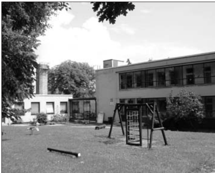
Mateřská škola Pardubická ulice