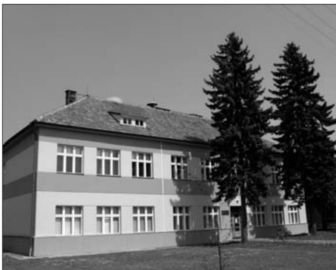
Mateřská škola Staroholická ulice