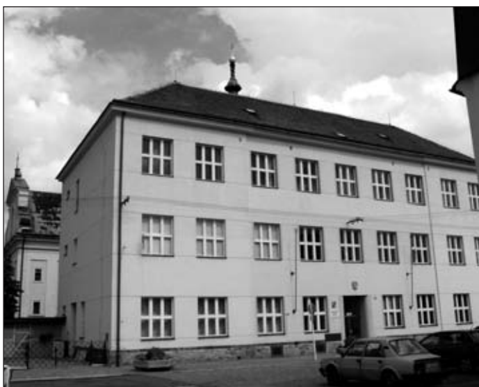
Základní škola Komenského ulice