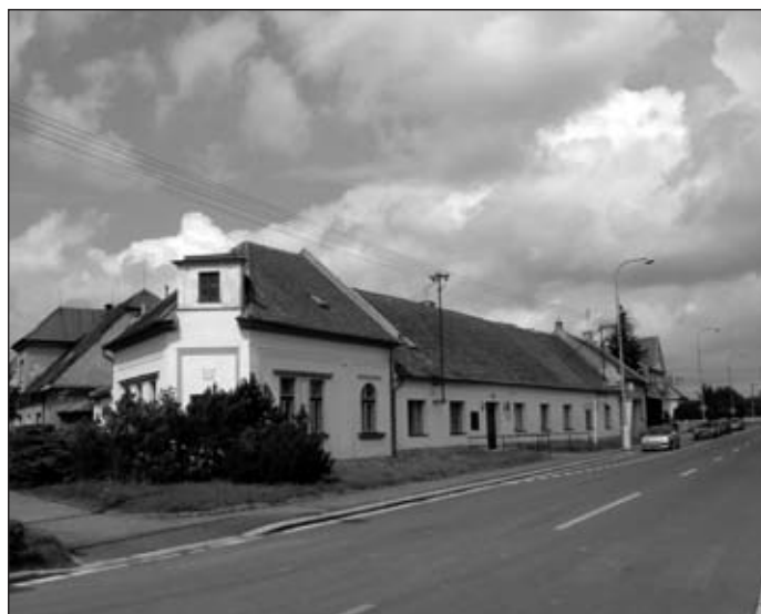
Základní umělecká škola