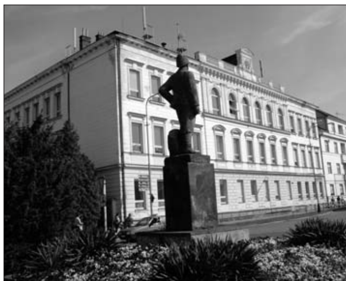
Základní škola Holubova ulice