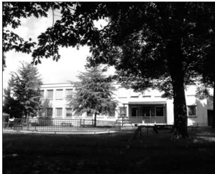
Mateřská škola Holubova ulice