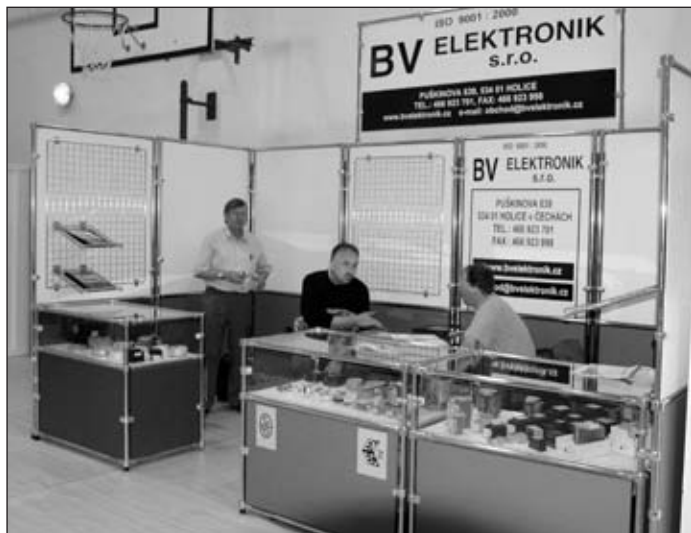
Holická firma BV elektronik na setkání

Poslední srpnový víkend neomylně signalizuje, že prázdniny se rychle chýlí ke svému konci a za dveřmi je nový školní rok. V Holicích však poslední srpnový víkend signalizuje i něco jiného. To „něco jiného“ je svátek všech nadšenců propadlých dálkovému vysílání, neboť nadešel čas dalšího mezinárodního setkání radioamatérů. Tentokrát se příznivci různých vlnových délek obého pohlaví, všeho věku a různých národností sešli v Holicích již po sedmnácté.