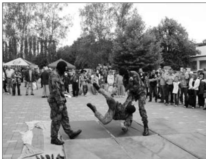
UNRA v akci

V sobotu již nepršelo, ba dokonce se občas ukázalo i sluníčko, a ke kulturnímu domu se vinul dlouhý had návštěvníků ze všech koutů republiky i z ciziny. Zpestřením dne byla ukázka zásahu příslušníků útvaru UNRA (Útvar rychlého nasazení) z Pardubic, kteří předvedli zadržení pachatele ujíždějícího v autě nebo ukázku bojových umění. Ale především se opět prohlíželo, zkoušelo, obdivovalo, nakupovalo a prodávalo radioamatérské vybavení. Diskutovalo se v různých kroužcích, uživatelé CB stanic si rozdali ocenění za uskutečněné závody a zhodnotili uplynulý rok.