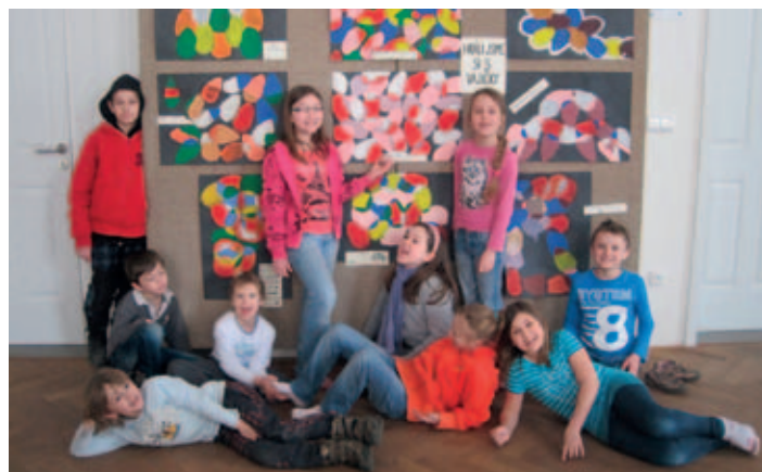
Kulturní dům v Dašicích

do pece, že se občas něco ulomí, ale zatím jsme si s tím vždy věděli rady. Práce dětí se vystavují především v místě jejich výuky, ať je to už ve škole nebo v kulturním domě. V letošním a příštím školním roce máme pro děti připravené výtvarné kurzy. Budou věnovány drátování, keramice a arteterapii.