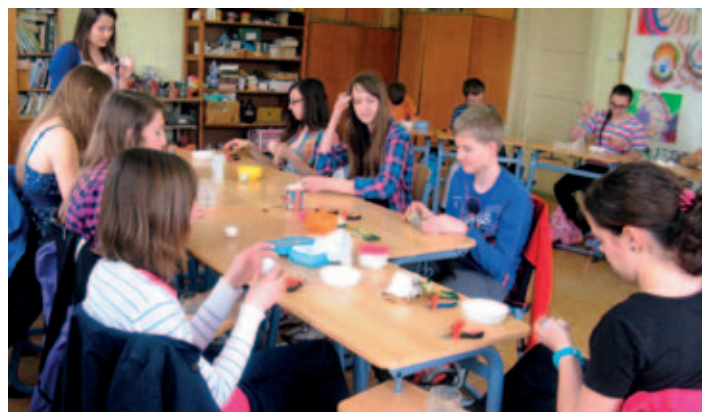
Kurz drátování pro děti z Býště