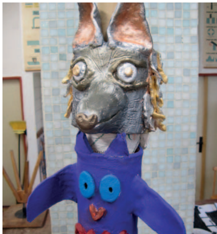
Totem od dětí ze Sezemic