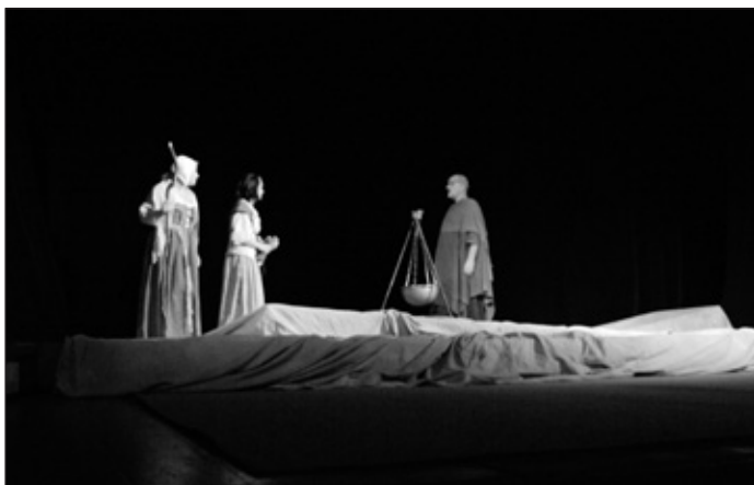
Inscenace „Pěnkava s Loutnou“

Jedna taková ochotnická přehlídka zavítala v roce 1998 i do Holic, a tak se jí tady zalíbilo, že zde již zůstala a v letošním roce se zde konala již po páté. Je to „Národní přehlídka jednoaktových her“. Již z názvu vyplývá, že když je to přehlídka národní, tak je to především republikové finále v tomto žánru. A tady asi nadchází ta pravá chvíle objasnit, co to vlastně ta jednoaktovka je. Tak tedy – jednoaktová hra je krátký divadelní útvar odehrávající se v jednom místě a v jednom čase, který by neměl být kratší dvaceti minut a delší než minut padesát. Tolik tedy definice. Pokud toto všechno vámi nastudovaná hra splňuje, můžete se přihlásit do některé z krajských přehlídek a doufat, že pokud budete tak dobří a zaujmete porotu natolik, že vám přiřkne přední umístění, získáte nominaci do finále – tedy do Holic.