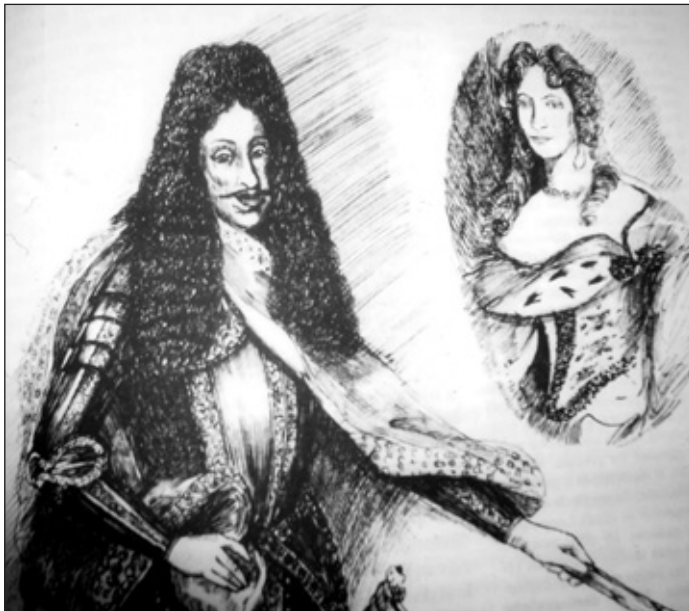
Císař Leopold I.

Průměrný sedlák v 17. století musel asi 60 % svého pracovního úsilí investovat „do cizího“, totiž do bezplatných robot a do vydávání peněz na daně. Platil kontribuci (státní daň), pozemkový úrok vrchnosti, církevní desátek a mnoho dalších poplatků. Platilo se ze všech řemesel, z mlýnů, z várek piva, z jarmarků, pivovarů, mýt, kořalky, hospod, ba i z „poslední dílny“ – za rasa a kata. Aby vůbec mohl poddaný zaplatit své daně a dávky, potřeboval nejméně třetinu výnosu z polí prodat na trhu. Čili: poddaní pracovali v průměru pouze z jedné třetiny na sebe a svou rodinu.