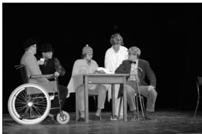
Inscenace „Věrní zůstaneme ....“

Letošní přehlídka se konala v sobotu 4. listopadu, kdy se po třinácté hodině na holických prknech představilo všech osm souborů nominovaných z celé republiky – Karlových Varů, Kuřimi, Děčína, Ostravy, Frýdku-Místku, Brna a pochopitelně z Holic. Po krátkém zahájení se hrálo a hrálo, aplaudovalo a fandilo. A velice rád konstatuji, že se opravdu letos bylo na co koukat a že ten, kdo se přišel podívat, určitě nelitoval. Herci nechávali na jevišti srdce i duši a platilo ono okřídlené „není malých rolí“.