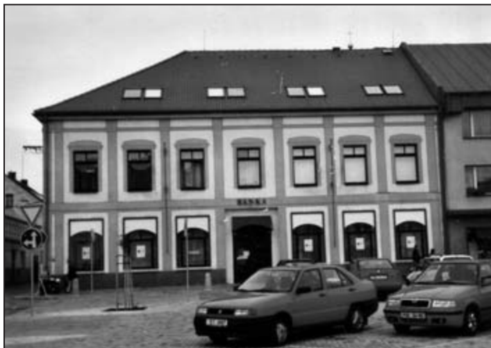
Budova bývalé Okresní hospodářské záložny

Protože město Holice nemělo poblíž vhodné lomy na kámen na zpevnění cest, byly zdejší cesty dlouho nezpevněny. Ani náměstí nebylo vydlážděno. Teprve ve francouzských válkách byly