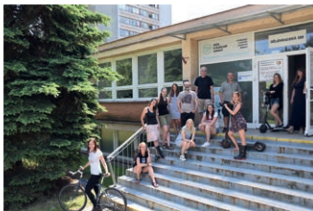
Tým Centra duševního zdraví Pardubice

Organizace Péče o duševní zdraví (PDZ) podporuje lidi s duševním onemocněním na jejich cestě k zotavení z vážné duševní nemoci, jako jsou schizofrenie či poruchy nálad, prostřednictvím propojených sociálních a zdravotních služeb. Jejím střediskem v Pardubicích – Centrum duševního zdraví Pardubice sídlí na adrese Bělehradská 389 prošlo v letošním roce rekonstrukcí. V rámci rekonstrukce bylo ve středisku vybudováno nejen nové zázemí a kanceláře pro zaměstnance, konzultační místnosti a ordinace pro schůzky s klienty, ale také tzv. denní centrum, kam mohou klienti PDZ volně přijít, trávit zde volný čas, setkávat se s ostatními a v případě života bez domova se třeba i umýt a vyprat si. Denní centrum se otevřelo pro zájemce od listopadu. Navštívit ho mohou volně v úterý odpoledne či v pátek dopoledne.