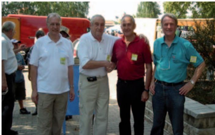
S předsedou ČRK