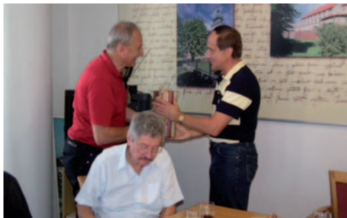
S holickým starostou