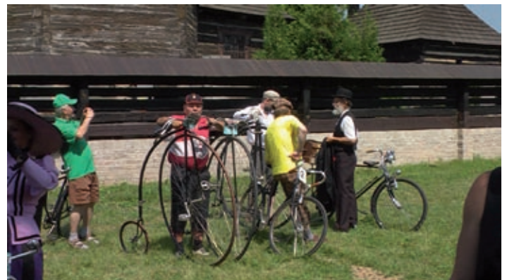
(Sportovní stránku připravil Petr Kačer)