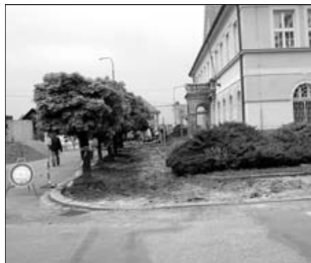
Chodník u pošty

Nemám strýčka ani jiného příbuzného v holických technických službách, nesedím tam v žádném honorovaném orgánu, nic takového. Jednoduše řečeno, je mi sympatické, když něco „odsýpá“. Technickým službám letos (a nejen letos!) odsýpala zimní údržba, současně jim odsýpají práce na dlouho opomíjených přístupových chodnících k poště. Myslím tím již opravený chodník od Majců k sil-