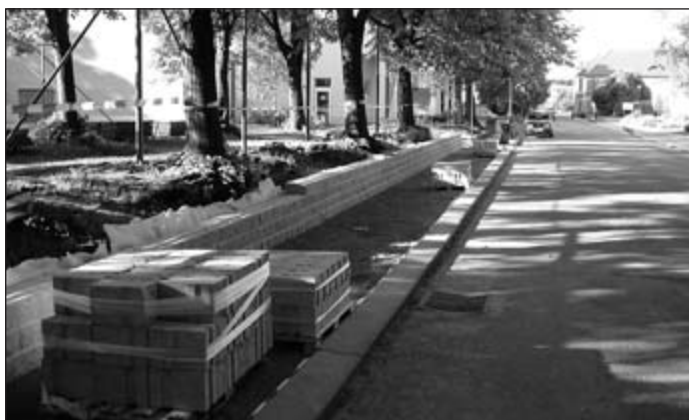
Rekonstrukce chodníku v Holubově ulici